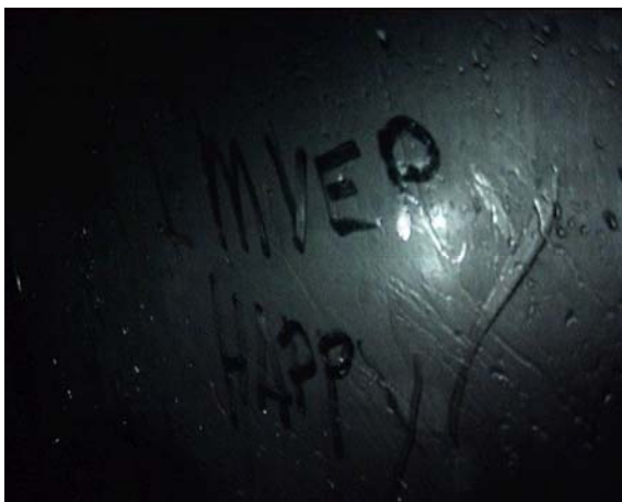
Leonora Bisagno, I AM VERY HAPPY , 2009, vidéo, 00'06, en boucle.

La recherche artistique de Leonora Bisagno, basée à Florence, est axée autour d'une réflexion sur l'image, sur sa nature-même. Elle travaille d'une manière récurrente avec des images pré-existantes et des objets trouvés.