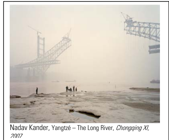
Nadav Kander, Yangtze – The Long River, Chongqing XI , 2007

Une inquiétude bourdonne comme un bruit de fond dans ces images : on oscille entre leur beauté intrigante et la menace imminente d'une réalité écologique en déséquilibre et d'une mémoire en en perte.