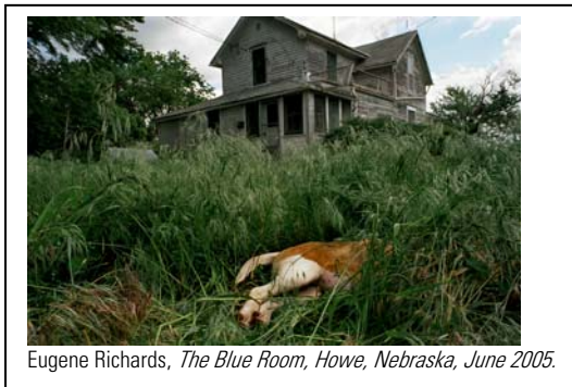
Eugene Richards, The Blue Room, Howe, Nebraska, June 2005.

L'exposition explore des univers multiformes, des approches diversifiées, brouillant les frontières entre démarche conceptuelle et documentaire, variant le degré de proximité et de distance, mêlant petites et grandes histoires.