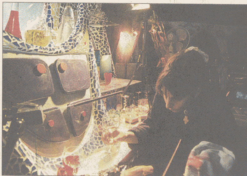
Präzisionsarbeit war bei der Herstellung von „Fragile“ gefragt